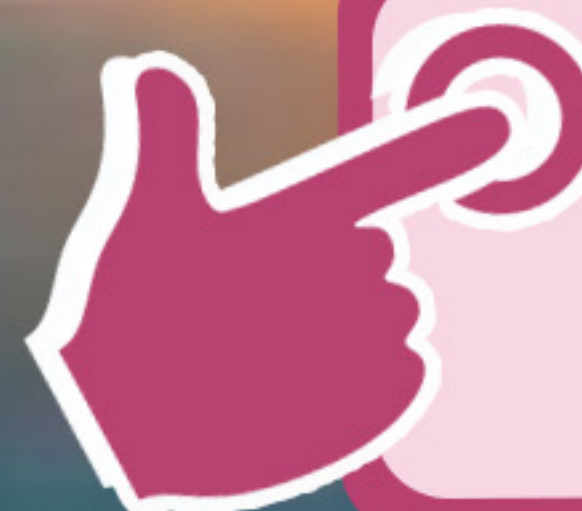
Table ronde sur la représentation du personnel : les différents mandats, outils de l'action syndicale dans l'entreprise